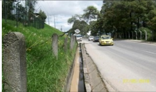
Foto 1. Se evidencia el vertimiento directo de agua residual con sedimentos disueltos a componente del espacio público (cuneta) que conduce las mismas a la Quebrada Padre de Jesús.

agua con sedimento hacia la cuneta que conduce hasta la Quebrada Padre de Jesús