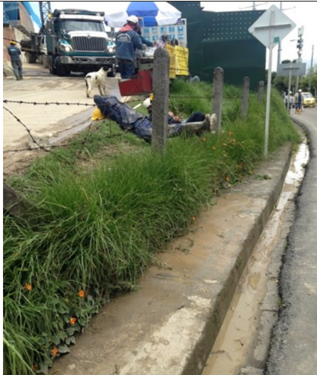
Foto 2 y 3. Recorrido del agua con sedimentos disueltos procedente de la plataforma de lavado vehicular hacia la quebrada Padre de Jesús.

Foto 1. Se evidencia el vertimiento directo de agua residual con sedimentos disueltos a componente del espacio público (cuneta) que conduce las mismas a la Quebrada Padre de Jesús.