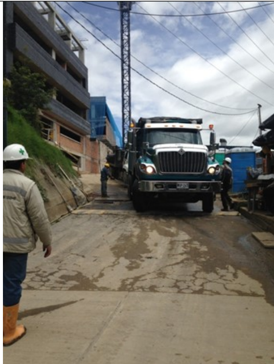
Foto 4 y 5. Recorrido del agua con sedimentos disueltos procedentes de la plataforma de lavado vehicular hacia la quebrada Padre de Jesús.